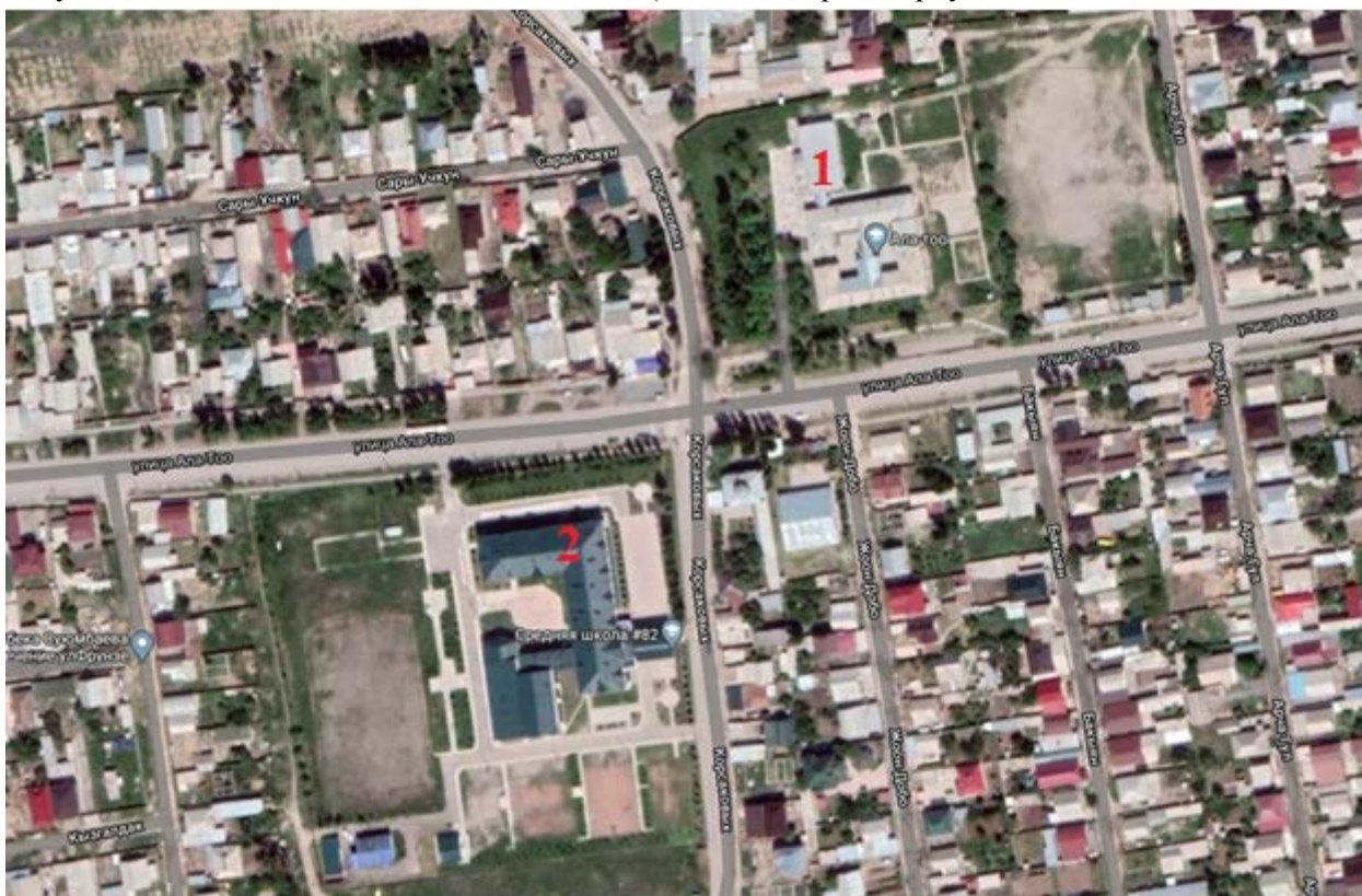
Рисунок 2. Жилмассив «Ала-Тоо» школа №82 (новый и старый корпус)