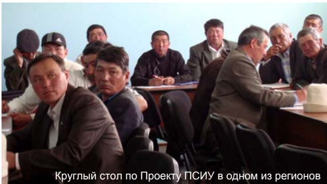
Круглый стол по Проекту ПСИУ в одном из регионов

В июне нынешнего года в 5-ти районах Нарынской области, Тогуз-Тороузском районе Жалал-Абадской и в Московском районе Чуйской области были проведены круглые столы по первому компоненту Проекта ПСИУ с участием специалистов Департамента пастбищ Министерства сельского, водного хозяйства и перерабатывающей промышленности КР, представителей АРИС, айльных округов, председателей айльных кенешей, руководителей действующих в каждом айльном округе жайыт комитетов объединений пастбищепользователей (ОПП).