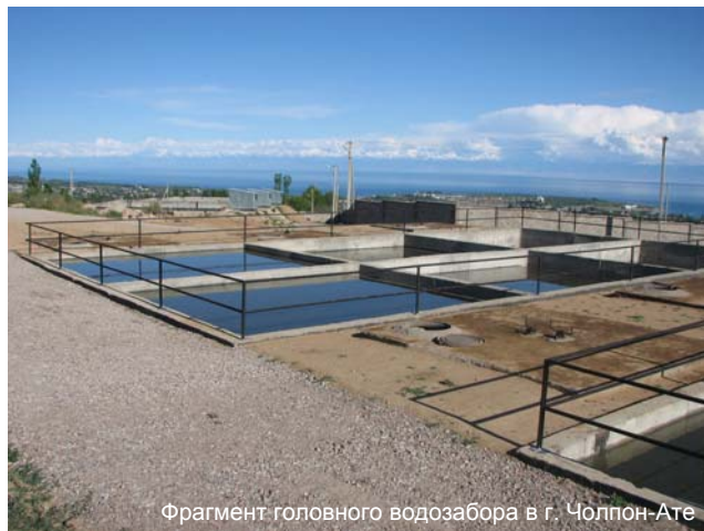
Фрагмент головного водозабора в г. Чолпон-Ате

Отныне, в г. Чолпон-Ате качественной питьевой водой будут обеспечены