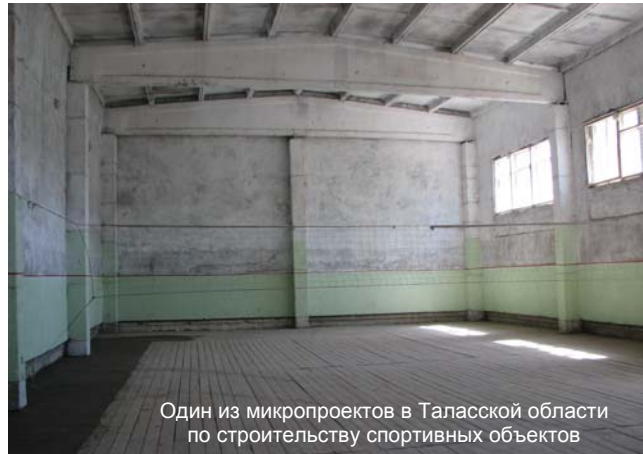
Один из микропроектов в Таласской области по строительству спортивных объектов

объектов представители сообществ получили ответы от сотрудников Таласского областного представительства АРИС на интересующие их вопросы по Проекту сельскохозяйственных инвестиций и услуг (ПСИУ), в частности, по выдаче жайыт билетов, организации обучения для кошуунов фермеров и др.