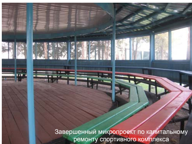
Завершенный микропроект по капитальному ремонту спортивного комплекса

1 887 097 сомов, из них грант сообществу, выделенный АРИС составил 1 494 956 сомов, вклад сообщества – 392 141 сом.