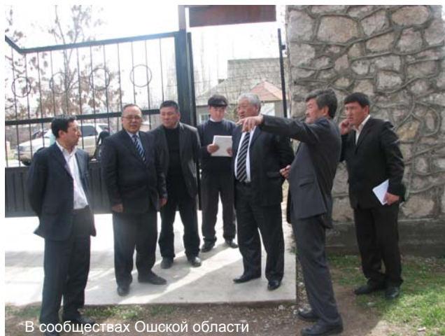
В сообществах Ошской области

Во время пребывания в Таласской области М. Токтоболотов встретился с представителями территориальных инвестиционных объединений (ТИО) Жергетальского и Коккойского аильных округов. В селе Кок-