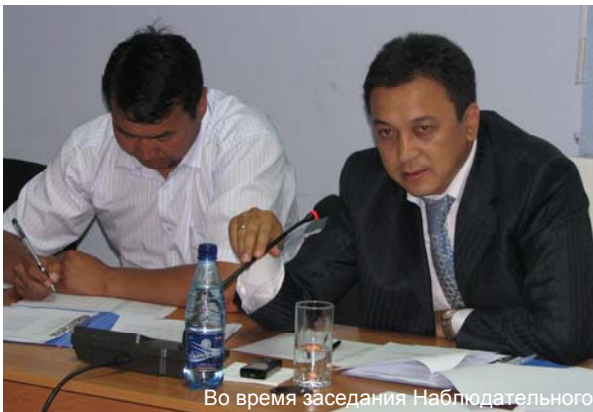
Во время заседания Наблюдательного