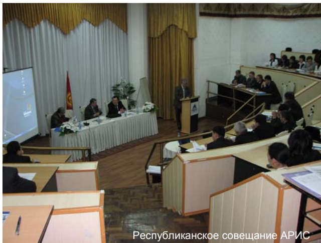
Республиканское совещание АРИС