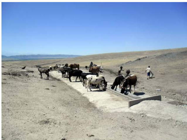
Чабаны трех сел Покровского айльного округа Манасского района

Таласской области поили свой скот на построенном еще в советское время водопое в урочище Кудук, который не ремонтировался в течение последних 25-30 лет. В следствие этого, обеспечение скота питьевой водой было минимальным.