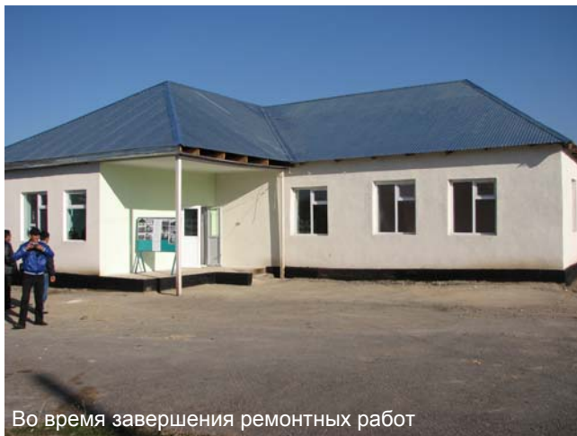
Во время завершения ремонтных работ

Выступая перед присутствующими, Исполнительный директор АРИС Э. Ибраимова отметила, что реабилитация этого здания под детский сад – это заслуга самих местных жителей, которые,